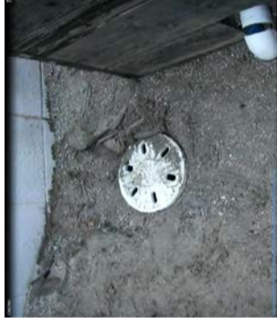
直径 30cm の蓋